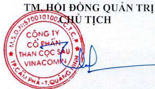
Trần Thế Thành